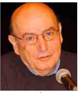
المخرج اليوناني ثيو أنجيلوبولوس

(فيما يلي متابعة لحديث المخرج اليوناني ثيو أنجيلوبولوس عن فيلمه "منظر في السديم" و عن عالمه السينمائي).. - لم أحاول أن أستمع لا الجاذبية الفطرية، ولا العنصر المثير للشفقة والمحتوم، الذي يستدعيه عادة حضور الأطفال، لوصورنا الفيلم على نحو مختلف، ووظفنا هذه الخاصيات بجلاء، لحقق الفيلم نجاحاً تجارياً كبيراً. لقد كنت واعياً جداً لهذه المجازفة لكن، من جهة أخرى، لم أرغب في ترقيع أدوارهم من كل عاطفة. كان علي أن أجد التوازن الملائم بين الاثنين. - العناصر الرمزية، بالنسبة لي، هي وسيلة للإفلات من تخوم السر السري، استكشافات العالم السورياتي، إنها مقحمة في تسريح السيناريو، مع إثنين في أحوال كثيرة لا أكون على يقين مما تعنيه هذه العناصر. على سبيل المثال، لا أستطيع حقاً أن أتحدث عن مغزى اليد الحجرية التي نُقلت من مرفأ ثيسالونيكي. يقلم: أمين صالح