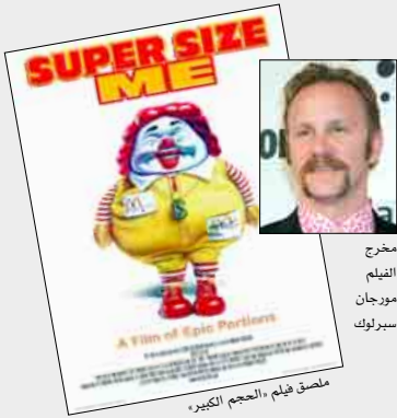
مخرج الفيلم مورجان سيرلوك

يعرض نادي البحرين للسينما هذا الأسبوع الفيلم الأمريكي الحجم الكبير للمخرج مورجان سيرلوك المتخصص في الأفلام الوثائقية الأمريكية، حيث يثبت في هذا الفيلم مدى التأثير السري للوجبات السريعة على صحة الإنسان من خلال تجربة عملية حيث يقترن لا يأكل إلا في الأوسكار لأفضل فيلم وثائقي، وسبق أن حصل على جائزة أفضل إخراج لفيلم وثائقي عام 2004.