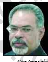
يقلم: حسن حياء

كذلك هو الحال للشخصية في فيلم (الساعات)، تلك الشخصية الهائلة دائماً عن متنفس لمشاعر المرأة والأخوة وحريتها في الفوج بهذه المشاعر، وإمكانية التخلص الفردي من الفجوة التي تفرض اجتماعياً أو التي يفرضها هو على نفسه، تبعاً لحالة أو مشاعر إنسانية مختلفة. فنرى تلك المرأة القوية التي تبقى لصيقة بصدق بصديقها المريض رغم علمها بميوله الأخرى وقضائها الأمل حتى من تمنائه لها، ثم محاولتها الاستمسية في إبقائه متصلاً مع الآخرين، وبرغم القوة العظيمة التي تتحلل بها هذه الشخصية، إلا أنها من الداخل تعاني هذه الهشاشة في رغبتها الصادقة بالتحرق من كل ما فرضته هي على نفسها. هذه المشاعر الاستثنائية، ضمن نموذجين فقط من الشخصيات التي شاهدناها لهذه الممثلة، (ربما يجحد القارئ شخصيات كثيرة ما زالت عالقة في ذاكرته) إنما هي خير دليل ولا يعطى في مفهوم صناعة الممثل في السينما، ولا يمكن أن ننسى بأن خبرة هذه الفنانة الحياتية ساعدتها بالطبع في اختيار شخصياتها السينمائية المتميزة، والنجاح أيضاً في تقديمها على الشاشة، وليست جائزة المعهد الأمريكي للفيلم، والتي خصصت عام 2003 لهذه الفنانة من مجمل أعمالها، إلا تكريماً لأهمية ميريل ستريب كفنانة كبيرة متميزة.. وواحدة من أهم من مثل، من الرجال والنساء، في تاريخ السينما العالمية. الشاشة السحرية التي تهين لنا صوراً لا تنسى.. عندما تمثلن هذه الشاعسة بصورة ميريل ستريب، نرى ذلك الوجه الدهش الأسر الذي لا ينسى أبداً.. تلك النظرة الغامضة التي تلحظنا في عمق أعينها وإحار الشخصية التي أمامنا.. إنه ذلك السحوري الجاوري الذي لابد له أن يستقر في ذاكرتنا طويلاً.. طويلاً..!!