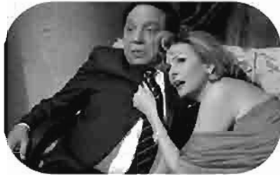
بوبوس Bobos Bobos