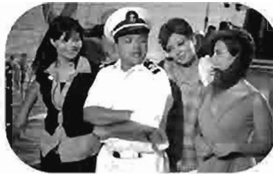
أمير البحار Amir Al-Bihar Amir Al-Bihar