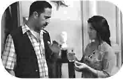
صياد الحمام The Doves Hunter Le Chasseur des Colombes