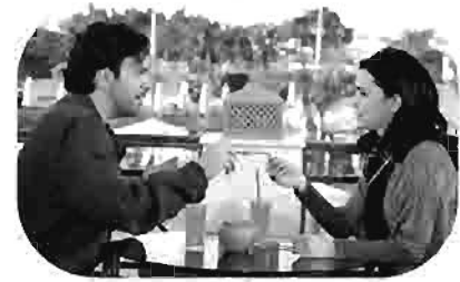
ميكانو Meccano Meccano