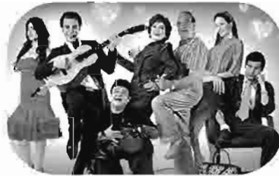
البييه زومانسى Romantic Bey Le Bey Romantique