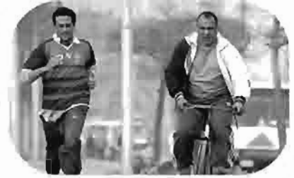
العالمي The Global Le Global