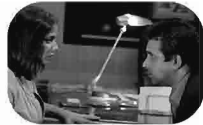
ولاد العم The Cousins Les Cousins