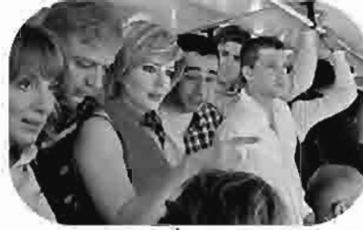
مجنون أميرة Crazy for the Princess Fou pour la Princesse