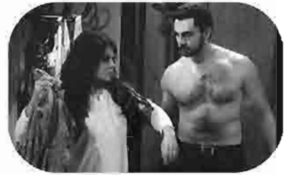
دكان شحاتة Shehata Store La Boutique de Chehata