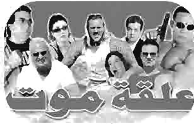
علقة موت Brawl deadly Bagarre mortelle