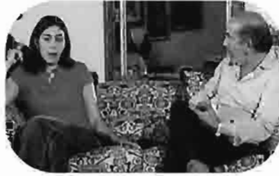
عين شمس Ein Shams Ein Chams