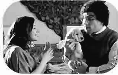
طير انت You.Fly Survol