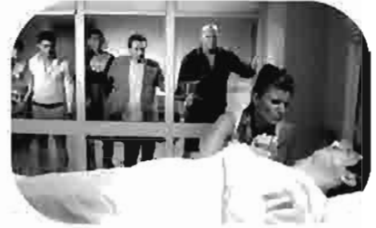
حفل زفاف The Wedding Party Cérémonie de mariage