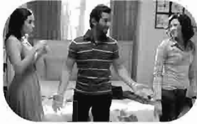
١٠٠٠ مبروك 1000 Mahrouk 1000 mabrouk