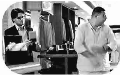
حد سامع حاجة ؟ Does anyone hear? Est-ce quelqu'un Entend?