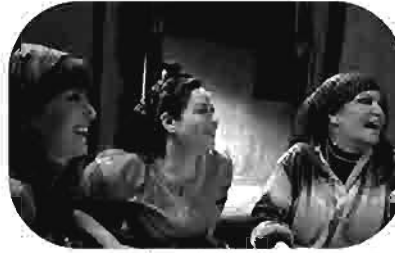
خلطة فوزية Fawzeya's Secret Recipe Le Mélange de Fawzeya