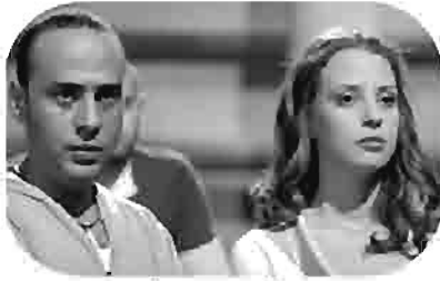
مكيدة حرامية Thieves' Trap Piège de voleurs