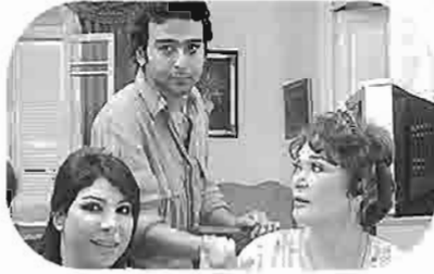
يوم ما التقينا The Day we Met Le Jour de notre rencontre