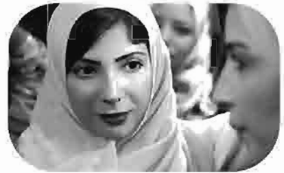
احكى يا تهرزاد Scheherazade, Tell Me a Story Femmes du Caire