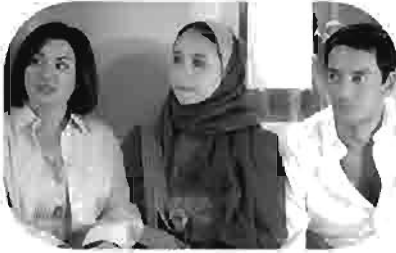
واحد صفر One-Zero Un-Zéro