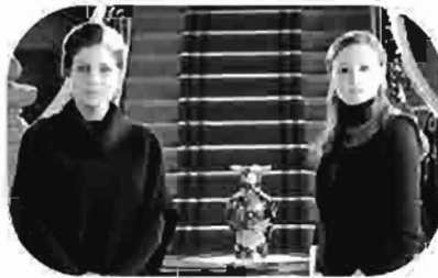
المشتبه The Suspect Le Suspect