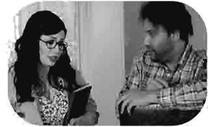
دكتور سيلكون Doctor Silkon Docteur Silkon