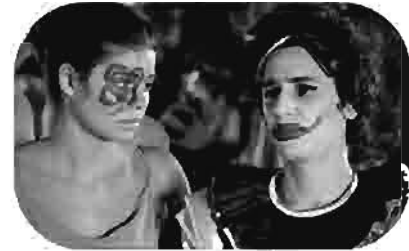
بالألوان الطبيعية Natural colors Couleurs Naturelles