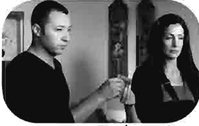
أزمة شرف A Matter of Honor Une Question d'honneur