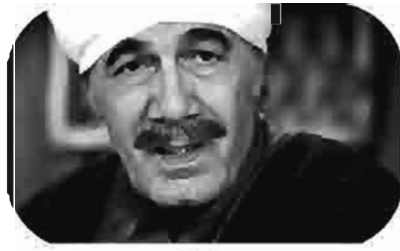
مزرعة آدم Adam's Farm La Ferme d'Adam