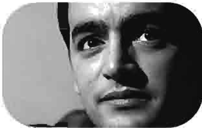
السطح The Serial Killer L'Assassin en Série