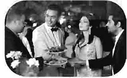
أفضل أصحاب Best Friends Les Meilleurs amis