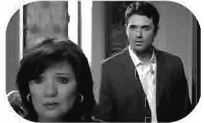
بدل فاند Replacement Remplacement