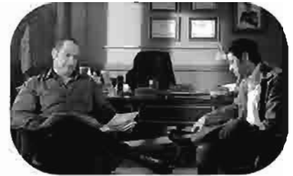
أدرينالين Adrenaline Adrenaline