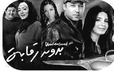
بدون رقابة Uncensored Sans Control