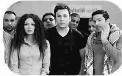
الأكاديمية The Academy L'Académie