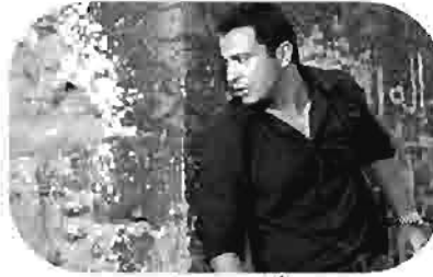
أيام صعبة Hard Days Jours Difficiles