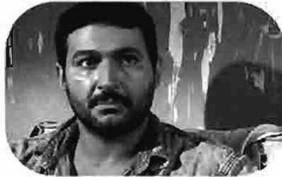
الفرح The Wedding La Noce