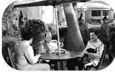
الديكتاتور The Dictator Le Dictateur