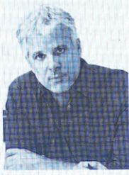
PRODUCER | ABOUT PRODUCTIONS GEORGES SHOUCAIR